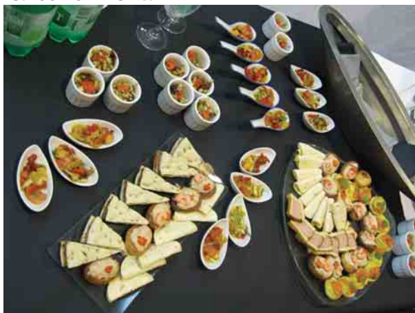
Mayonnaise, moutarde, cornichons, vinaigrette et beurre

Nos prix sont estimés en livraison avec les condiments